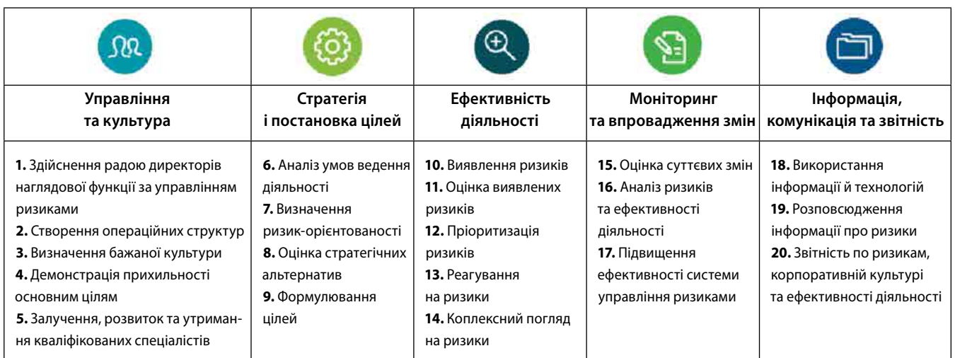
Таблиця 1: Структура стандарту

Комітет спонсорських організацій комісії Тредвей (The Committee of Sponsoring Organizations of the Treadway Commission, COSO) (далі – Комітет