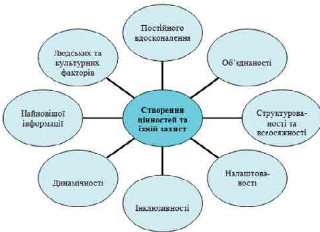
Схема 1: Мета та принципи

Комітет спонсорських організацій комісії Тредвей (The Committee of Sponsoring Organizations of the Treadway Commission, COSO) (далі – Комітет